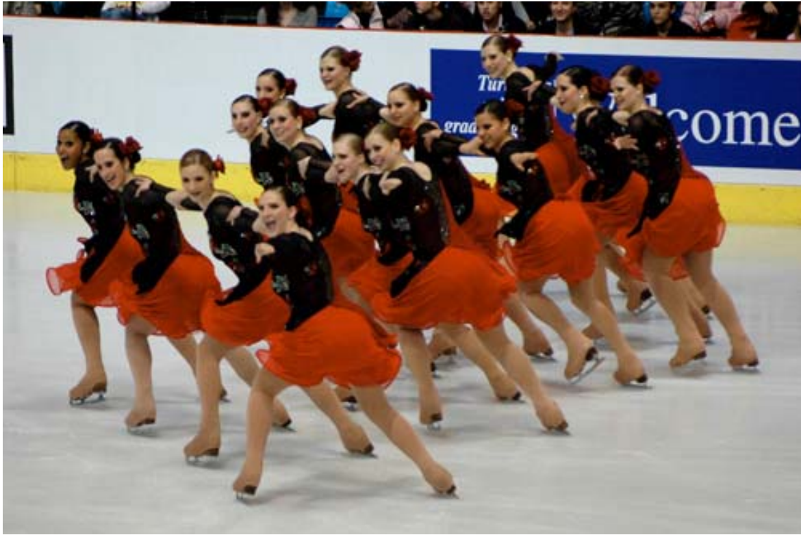
Starlight Team, Schweizermeister Synchronized Skating (Seniors)